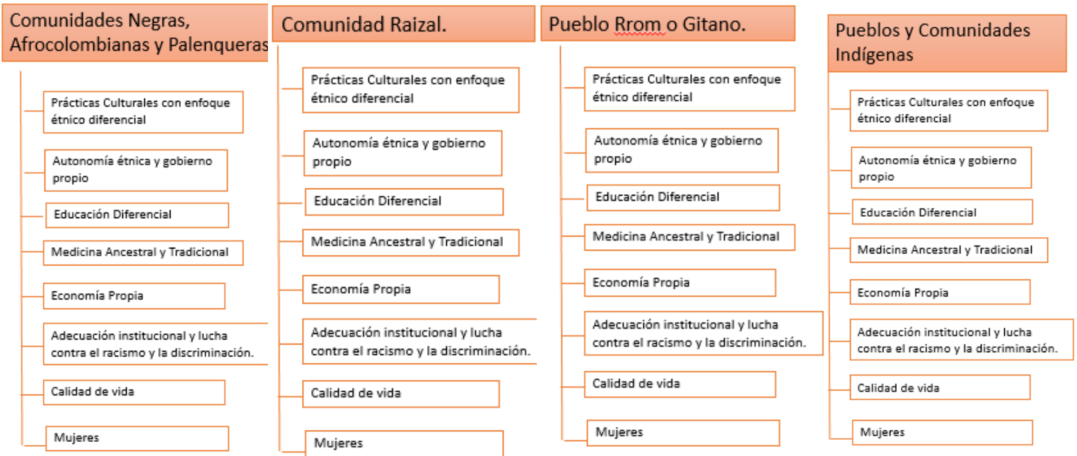
Ilustración 1. Estructura categorías y subcategorías del Trazador Presupuestal de Grupos Étnicos.